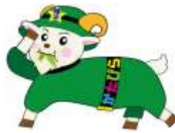
帷子地区センターイメージキャラクター 「くさなックス」